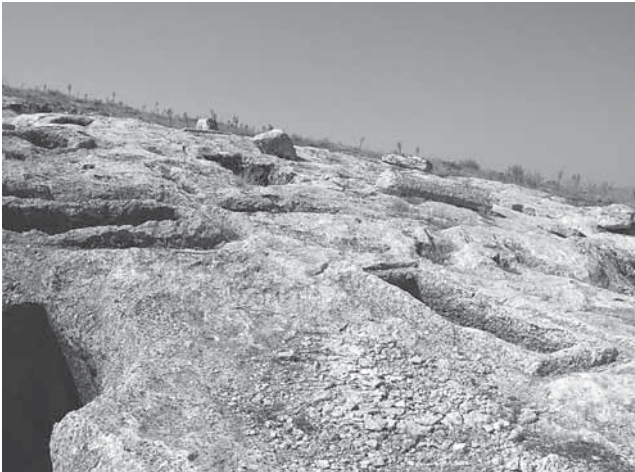
Seleukeia Sidera Antik Kenti Nekropolis Alanındaki Kaya Mezarları

Seleukeia Sidera antik kenti, nekropolis alanında açığa çıkan ve halen Isparta Arkeoloji Müzesi'nde korunmakta olan buluntular, Pisidia Bölgesi'ndeki bir çok yerleşimde olduğu gibi, Hellenistik Dönem'den itibaren, Roma Dönemi'nin içlerine dek süren kesintisiz bir yerleşime işaret etmektedir (Hellenistik Dönem Pisidia kentlerine ilişkin olarak bkz. Özsait 1985: 112-130; Mitchell 1992: 7-21). Isparta Arkeoloji Müzesi'nde korunmakta olan ve "cenaze büstleri" olarak bilinen