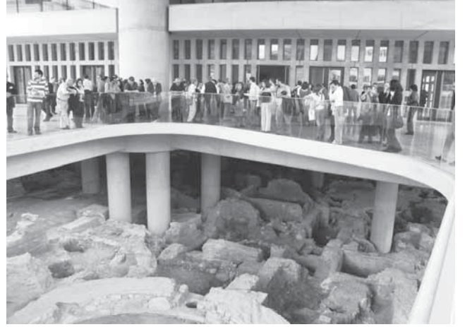
The Aegean Early Bronze Age: New Evidence başlıklı sempozyum sırasında gezilen ve Akropol’ün eteğinde inşa edilmekte olan müzeden bir görünüm

Sempozyumun sonunda tanınmış prehistoryacı Collin Renfrew, yapılan konuşmalar ve ulaşılan sonuçlarla ilgili olarak bir synopsis sunmuştur. Bu sempozyumda, Batı Anadolu ve Ege Dünyası arasında prehistorik dönemler açısından ivedilikle çözümlenmesi gereken en önemli sorunun “kronoloji ve terminolojide birlik sağlanması” olduğu hususunda görüş birliğine varılmıştır. Bu sorunun ele alınacağı diğer bir sempozyumun da Türkiye’de yapılması temennisinde