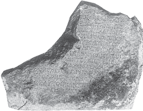
Resim 6. Doğu Kulede Ele Geçen Hellenistik Dönem Adak Yazıtı (Lafli, a.g.m., s. 95 Fig. 11)