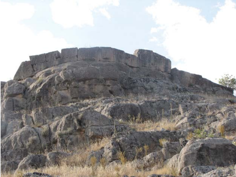
Resim 3. Seleukeia Sidera Antik Kent Planı (Lafli, a.g.m., s. 90 Fig. 3'ten uyarlama)