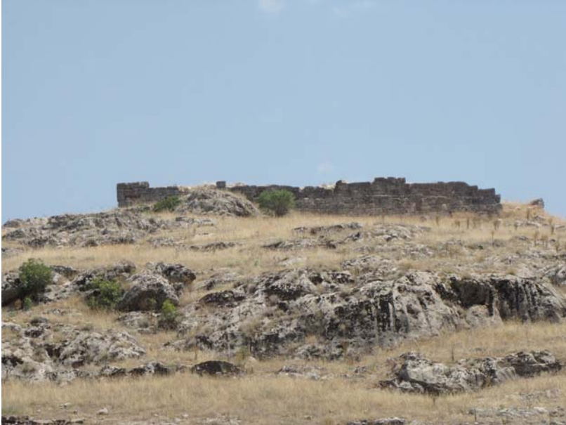
Resim 5. Podyumlu Yapı – Tapınak