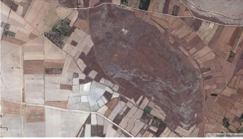
Resim 2. Asartepe ve Seleukeia Sidera (Google Earth – Eriřim Tarihi: 20.07.2015 )