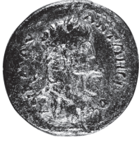
Prostanna. Elagabalus (218-222)

Env. No. SLV-61-S10/93 (Müze etüdü- lük)