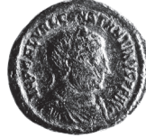
I. Constantinus (307-337). Nikomedeia

Büst s. / Iupiter ayakta sl.; globus üzerin- de Victoria ve ucunda kartal olan asa tu- tuyor; solda, kartal ve sağda esir.