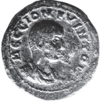
Baris. Hostilianus (251)

Büst s. / İki sütunlu tapınak içinde Tykhe sl.