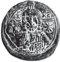
VII. Mikhael (1071-1080). Konstantinou-