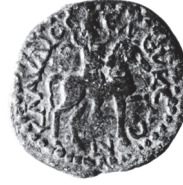
Klaudia Seleukeia. I. Paula Cornelia